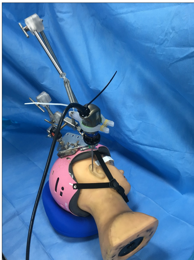
Fig. 2. Application of the helmet-mounted endoscopic holder on a head model. This is a representative photograph of the proposed endoscopic holder system mounted on a human head model. The device is securely stabilized using a helmet-based platform with a chinstrap. The articulated arm allows for precise positioning and steady maintenance of the endoscope angle, facilitating hands-free endoscopic procedures in otolaryngology.

제작된 시제품을 사체 모델에 적용하여 그 유용성을 평가하였다. 3인의 이비인후과 전문의가 장치 장착 및 실습 과정을 수행한 결과, 모든 술자가 본 장비의 고정력과 시야 확보 능력에 대해 높은 만족도를 나타냈다. 특히 장비 사용 시 내시경의 위치가 안정적으로 유지됨으로써 보조 인력 없이도 원활한 양손 수술이 가능함을 확인하였다(Fig. 3).