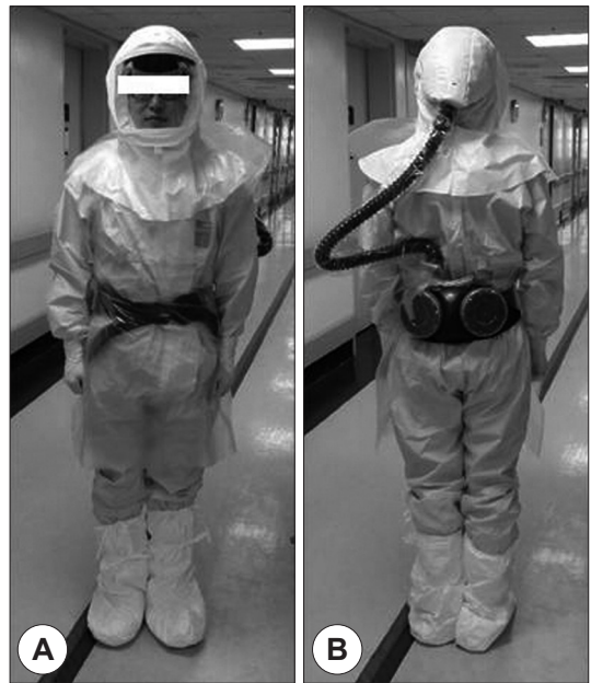
Fig. 2. Level C personal protective equipment front (A) and back side (B). It consists of chemical resistant clothing, full-face mask and powered air-purifying respirator.

환자는 양와위에서 어깨받침을 이용하여 목이 최대한 신전되도록 하였다. 경부, 안면, 흉부의 상부, 어깨를 포비돈 요오드 용액으로 닦은 후 일회용 수술포를 덮고 수술을 시작하였다. 1% 리도카인과 1 : 100,000 에피네프린 혼합 용액을 절개부위의 피부와 피하에 주사하였다. 제 2~3 기관륵에 접근이 용이하도록 피부 횡절개를