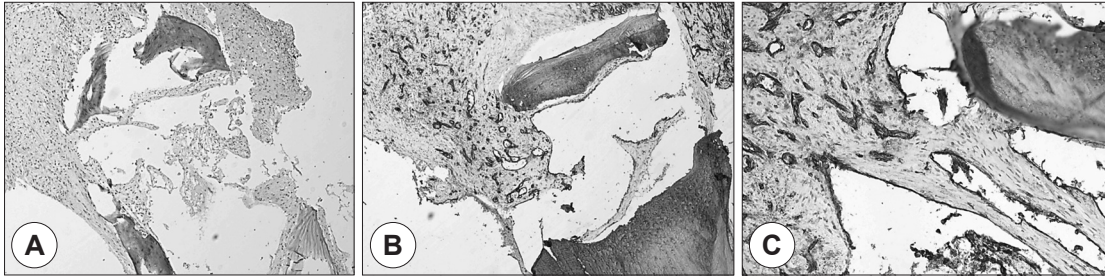
Fig. 3. A : Histopathologic specimen of the tumor shows thin-walled vessels and enlarged vascular channels between the bony trabeculae (hematoxylin and eosin staining \times 40 ). B : Immunohistochemistry demonstrates positive staining of the endothelial cells for CD31 ( \times 40 ). C : Magnified slide of immunohistochemistry for CD31 ( \times 200 ).

술 후 병리조직검사 결과에서 골조직 사이에 존재하는 확장된 혈관 구조물이 주된 소견을 보여 골내 혈관종으로 확진되었으며, 추가적으로 시행한 면역병리검사에서 혈관 내피세포 특이 단백질 CD31에서 양성인 결과를 확인할 수 있었다(Fig. 3). 수술 후 호소하던 비배부의 압통은 소실되었고, 현재 술 후 1년 동안 증상의 재발이나 외비의 변형, 비강내의 협착 등의 합병증 없이 경과 관찰 중에 있다.