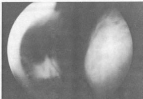
Fig 3. Left nasal cavity endoscopic view; Septal perforation reconstruction by temporalis muscle fascia graft is noted.